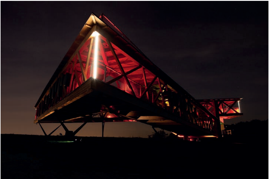
ohne Titel | Inszenierung der Aussichtsplattform der Landesforsten Rheinland Pfalz 7 LED Linien LED Linear | 7 U-Profile Aluminium | 9 Pin Spots | LEE Filter 106 | e:cue Nano+ | Verkabelung Konzept + Licht: Herbert Cybulska | Kuratoren: Bettina Pelz, Tom Groll | Lichtströme Koblenz 2011 | Foto: Jennifer Braun