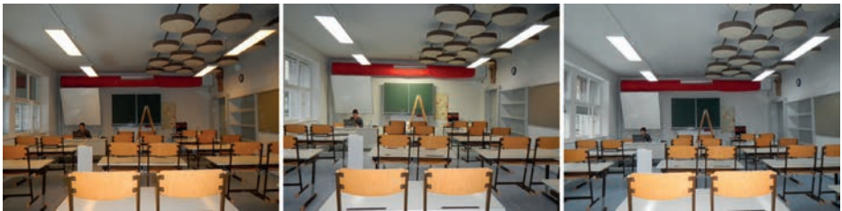
Abbildung 1 Klassenzimmer in unterschiedlichen Farbtemperaturen (3200K, 4000K, 5800K)

Ziel der Untersuchungen, die im Rahmen des Forschungsprojektes in der Hauptschule Hötting (Innsbruck) durchgeführt werden, ist die Wirkung der Lichtfarbe und Lichtfarbenkombinationen hinsichtlich der Nutzerakzeptanz, der Lichtqualität und der Energieeffizienz zu untersuchen und in Empfehlungen zu Steuerstrategien des Kunstlichtes umzusetzen.