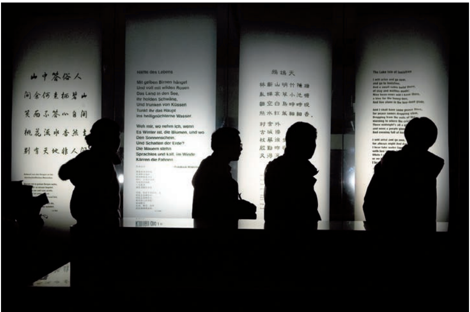
„Poems of Light“ | (Ausschnitt Erdgeschoss) Klarsichtfolie bedruckt | Chinesisches Papier | Scheinwerfer ETC Source 4 26° | Lichtsteuerung | Shanghai 2008 Architekt: Kengo Kuma | Bauherr: Zhongtai | Temporäre Lichtinstallation: Herbert Cybulska