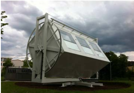
Abbildung 1 Versuchsanlage für Fassaden an der Hochschule Rosenheim

Johannes Zauner, Mathias Wambganß, Franz Feldmeier; Hochschule Rosenheim